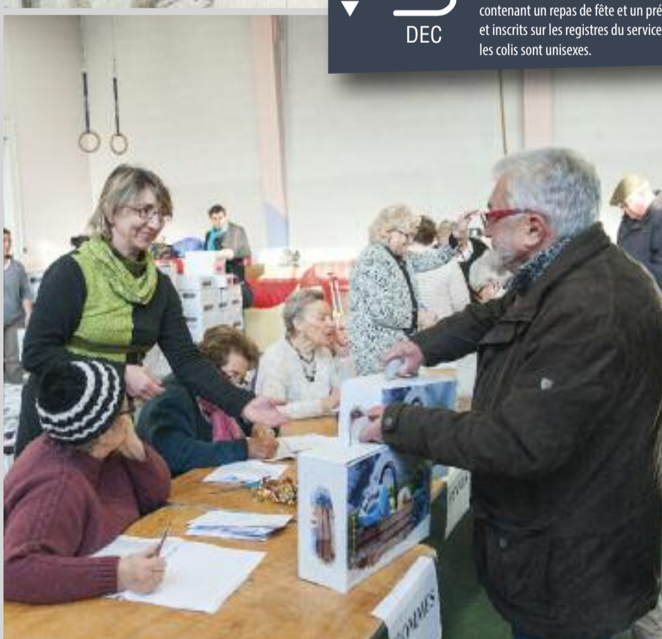
Des colis de fin d'année pour les aînés La députée-maire, les élus et les bénévoles étaient au rendez-vous pour remettre les colis de fin d'année. L'événement a eu lieu jeudi 3 décembre dans différents points de retraits. Quelques 3730 boîtes contenant un repas de fête et un présent ont été remises aux seniors de la ville âgés de plus de 65 ans et inscrits sur les registres du service municipal des Retraités. Grande nouveauté pour cette année : les colis sont unisexes.